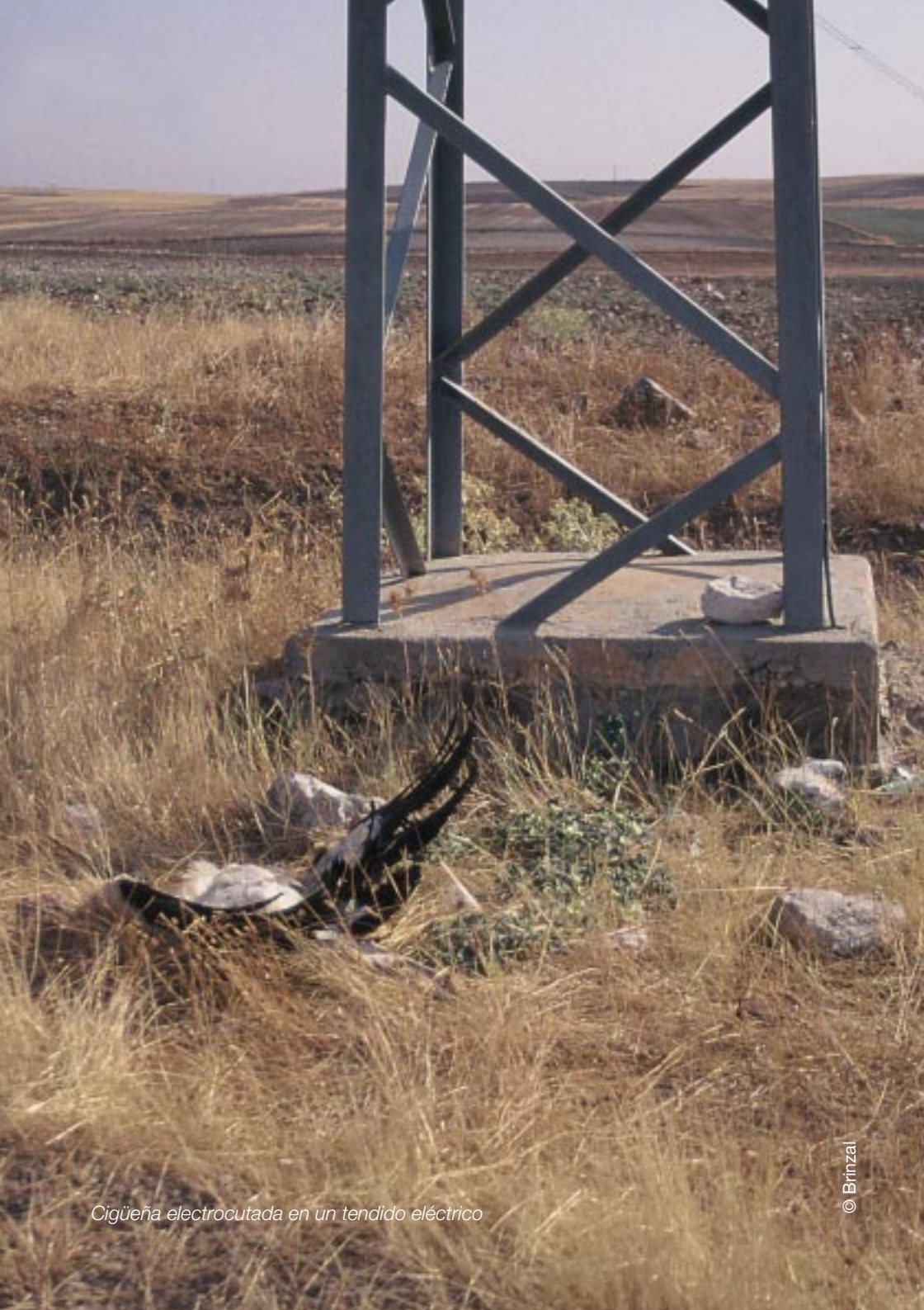
Cigüëna electrocutada en un tendido eléctrico