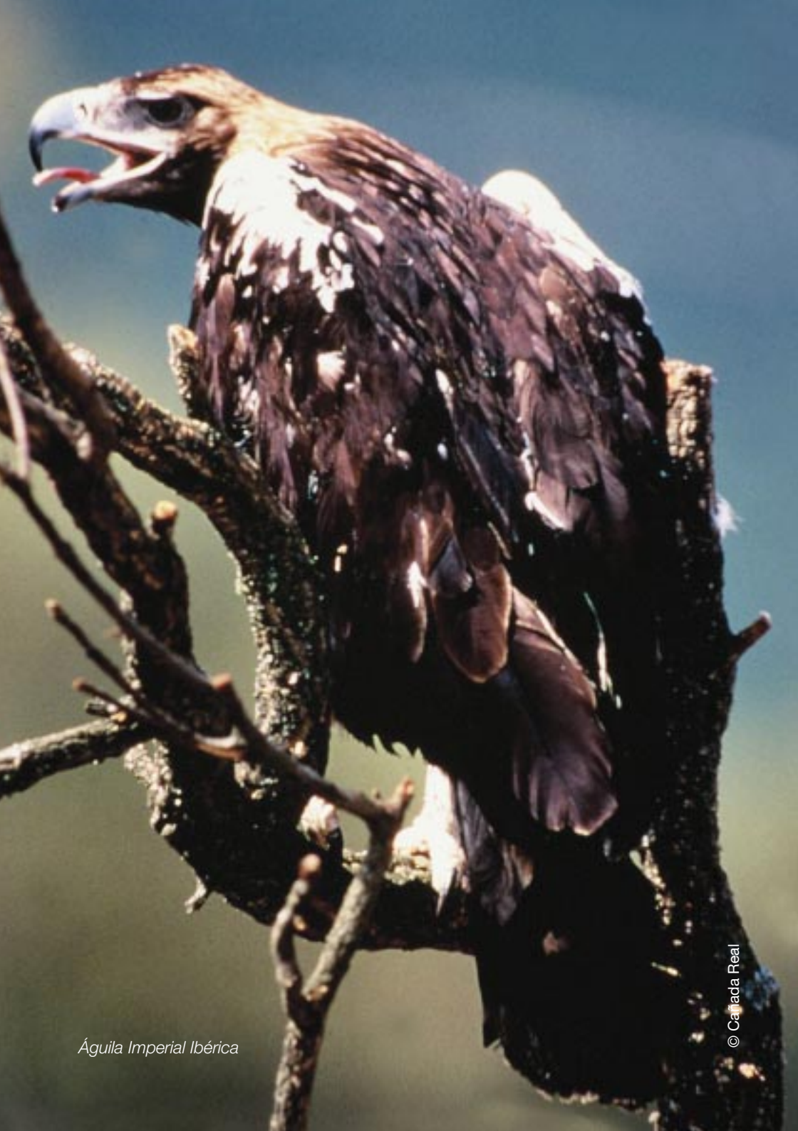
Águila Imperial Ibérica