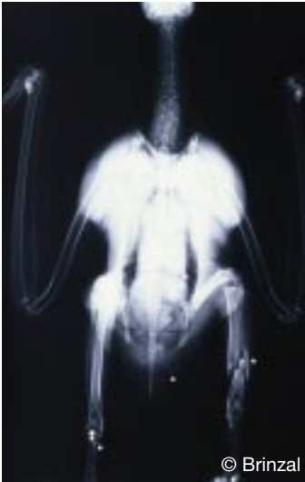
Radiografía de un Águila Pescadora abatida por disparo.