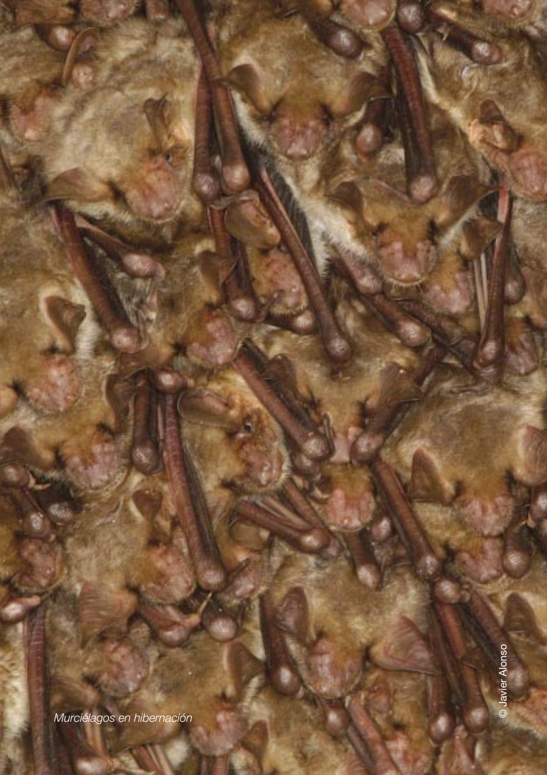
Murciélagos en hibernación