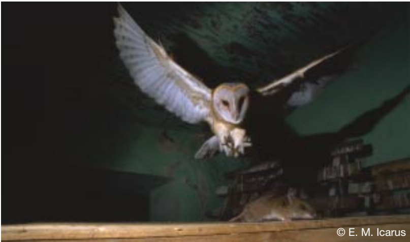
La Lechuza Común depreda sobre micromamíferos, y por ello puede verse afectada por los rodenticidas

Son venenos utilizados en la lucha contra las ratas y ratones. Elaborados con anticoagulantes, pasan a través de la cadena trófica con facilidad pues los roedores afectados son más fácilmente depredados, transmitiéndose y afectando al químico al depredador que muere a causa de las hemorragias internas que el veneno le produce.