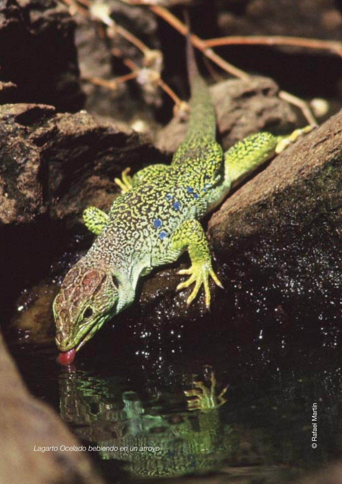
Lagarto Ocelado bebiendo en un arroyo